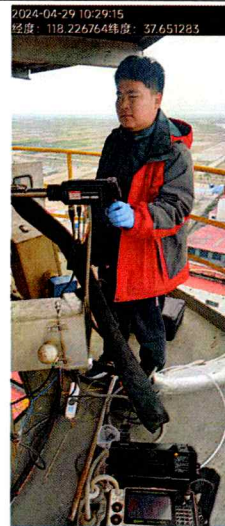
附图 1 现场照片